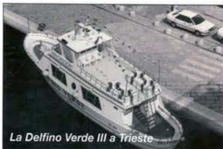
La Delfino Verde III a Trieste