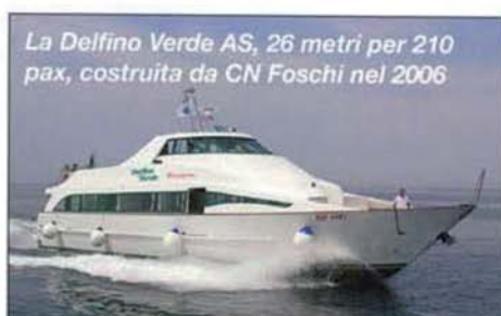
La Delfino Verde AS, 26 metri per 210 pax, costruita da CN Foschi nel 2006